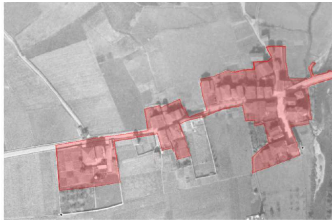
Ortofoto de Narbarte entre los años 1927 y 1934