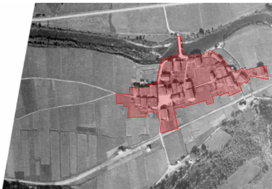
Ortofoto de Legasa entre los años 1927 y 1934

Además, si se estudia el planeamiento actual, se puede apreciar que estas zonas se corresponden con las áreas donde se sitúa el mayor número de edificación protegida. Al analizar las ortofotos históricas de los diferentes concejos y los planos donde se indica la ubicación de la edificación protegida esta coincidencia se puede apreciar nítidamente: