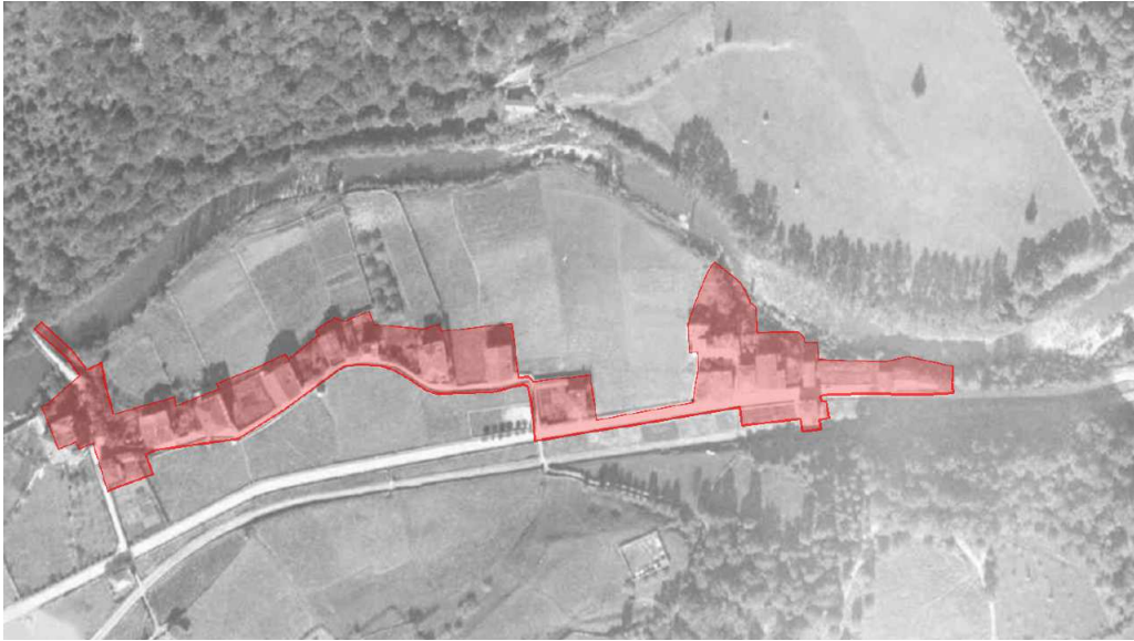
Ortofoto de Oieregi entre los años 1927 y 1934