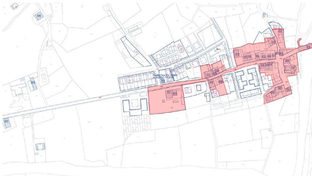
Plan General Municipal actual (las edificaciones protegidas se representan ralladas en azul)