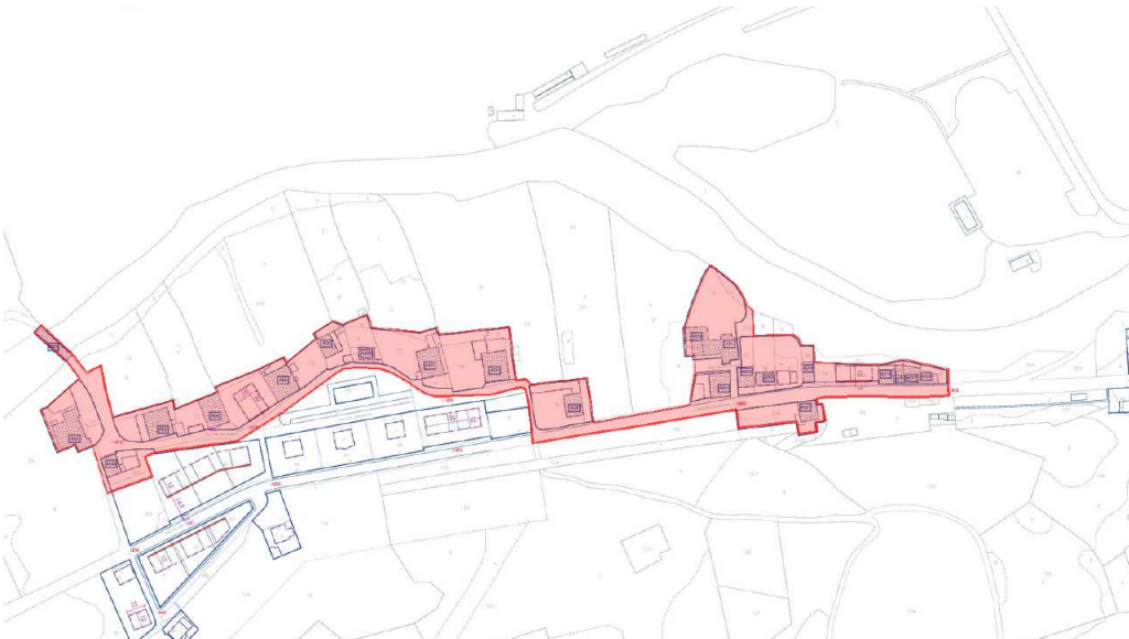
Plan General Municipal actual (las edificaciones protegidas se representan ralladas en azul)

Por ello, se entiende que se debe delimitar estos sectores con el fin de preservarlos al tiempo que fuera de ellos se permita una mayor libertad en cuanto a las técnicas constructivas y materiales que se acepten.